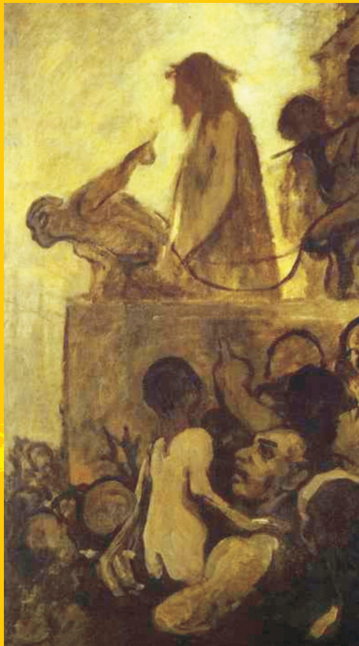
Queremos a Barrabás (1850). Honore Daumier

cesaban de imprecicar y vilipendiar al reo. Sin saber muy bien por qué, Barrabás se sintió atraído por tan extravagante séquito; apuró su vasija de vino y se incorporó al grupo. Al fin y al cabo, pensó, le debía