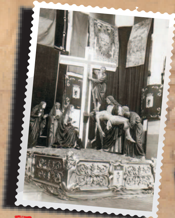
El Descendimiento (Víctor de los Ríos), el día de su presentación oficial, en marzo de 1945, con la cruz luminosa, posteriormente retirada del conjunto.