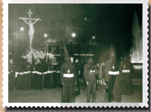
El primer preso liberado por la Cofradía de El Perdón, en el año de su estreno (1965). Detrás, "La Crucifixión", del Dulce Nombre, cedido para la ocasión.