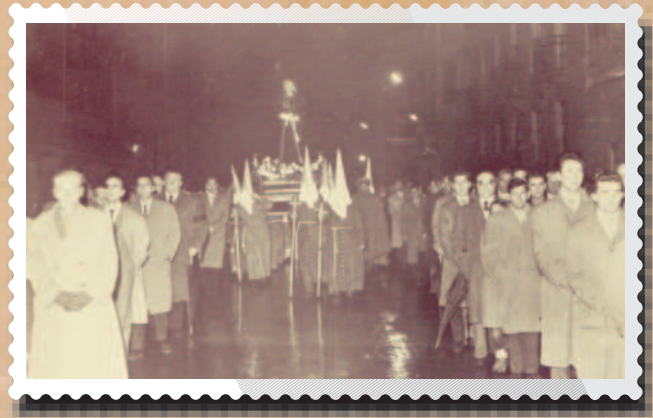
Miércoles Santo de 1949. Procesión del Silencio.